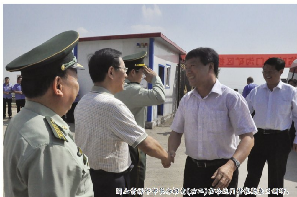
国土资源部部长徐绍史(右二)在哈达门整装勘查区调研。