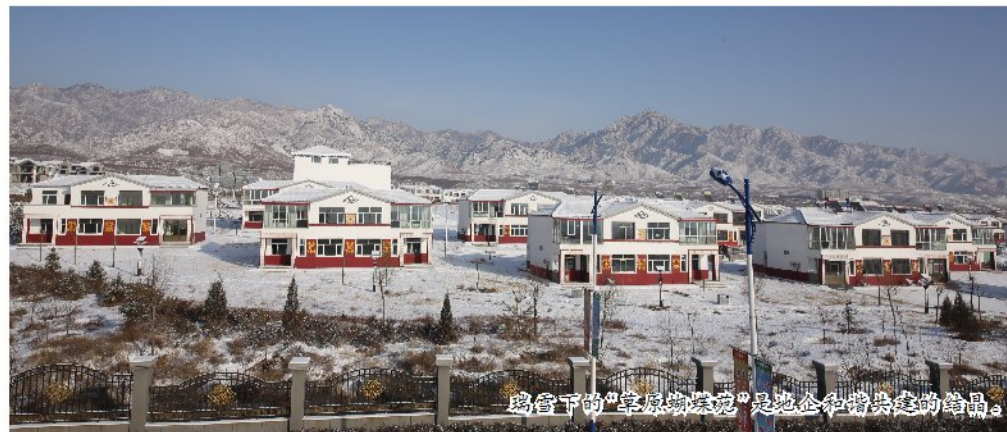
鸟瞰下的“草原蝴蝶苑”是地企和谐共建的结晶。

风物长宜放眼量。鑫达十年,安全标准化、管理数字化、生产现代化、发展科学化、眼光国际化,靠的就是科学发展、绿色发展、和谐发展。放眼未来,面对“十二五”未建成世界一流公司、迈入世界五百强的集团目标,身为中国黄金集团的佼佼者,鑫达公司更有义务向国际社会展示“国之央企、国之重器”的中国中央企业形象和内涵,将中国黄金的品格展现给世界人民。