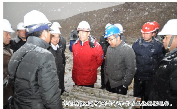
李廷栋院士(中)等专家学者在鑫达勘探现场。