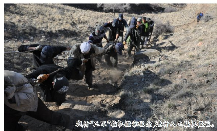
践行“三不”钻机搬家理念,进行人工抬机搬运。